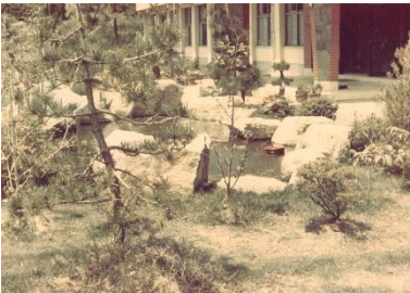
《S 4 6 中庭完成》