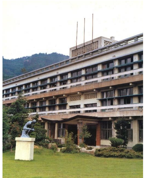
《S 5 5 年頃の玄関と中庭》