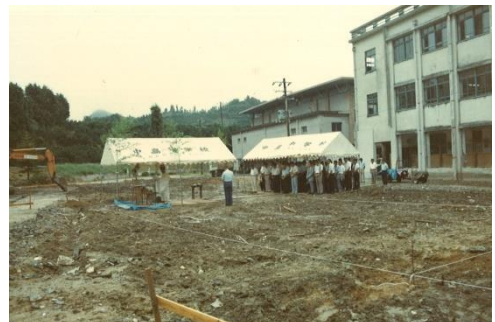
《S 5 9 特別教棟着工》

※ 昭和59年に、現在の特別教棟の新築工事が始まり、昭和60年3月に完成しました。