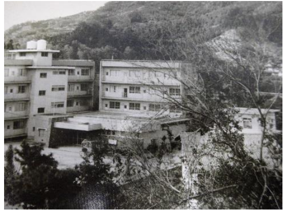
《S 4 5 寄宿舍青潮寮の落成》