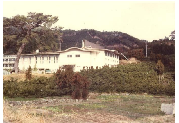
《S 4 9 町民柔剣道場落成》