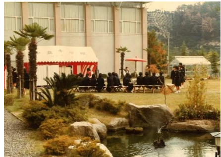
《S 5 3 中庭でのお茶会》