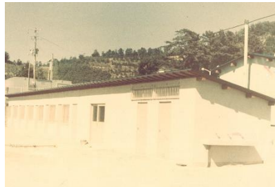
《S 4 8 部室完成》