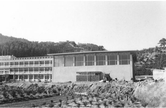
《S 4 6 体育館落成》