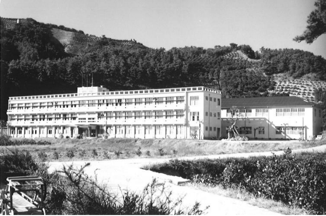
《S 4 5 年頃の本館と特別教棟》