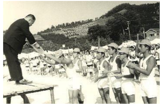
《S 4 7 西中と統合後の運動会》