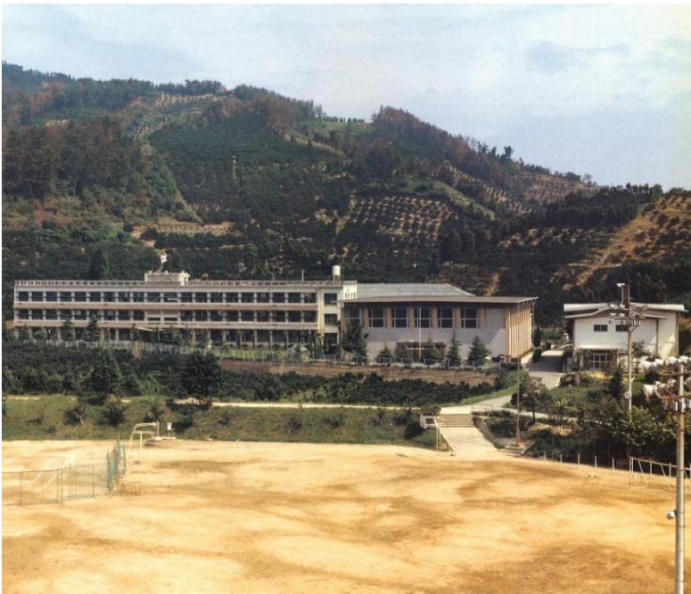
《S 5 5 年頃の校舎遠景》